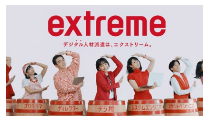
デジタル人材派遣は、エクストリーム。